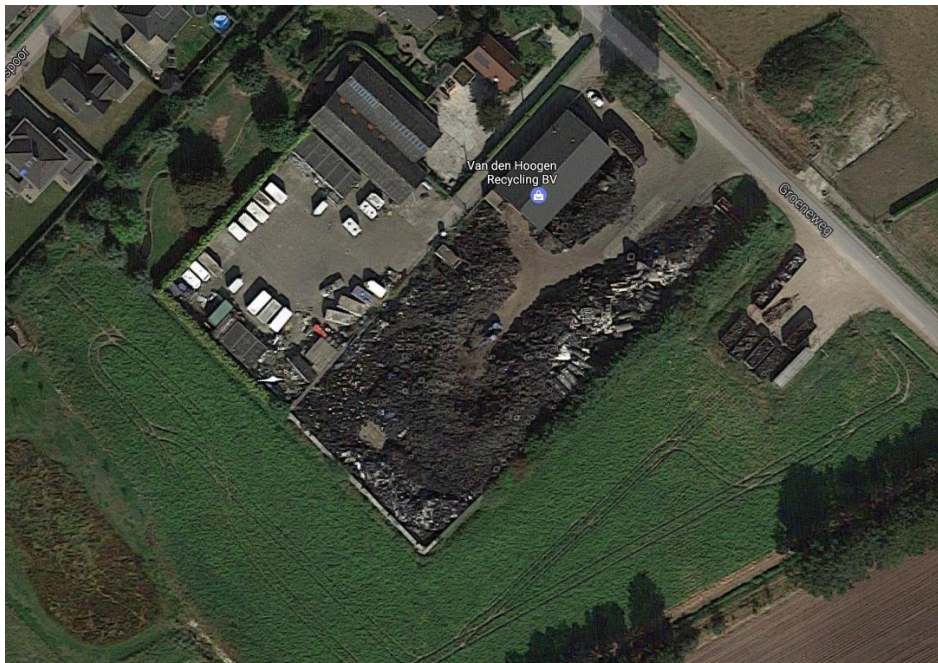
Figuur 3.1 Bovenaanzicht van Van den Hoogen Recycling BV

Van den Hoogen Recycling BV was op de Groeneweg 14 te Someren-Heide actief in de periode 2004 - 2016 1 . De onderneming had als primaire bedrijfsactiviteit de op- en overslag van autobanden en heftruckbanden afkomstig van de industrie en andere rubberen materialen. De banden werden ingekocht van bandenhandelaren uit België en Nederland. Ook haalde het bedrijf - dankzij een provinciale subsidieregeling 2 - in de beginperiode veel banden op bij agrariërs in de regio.