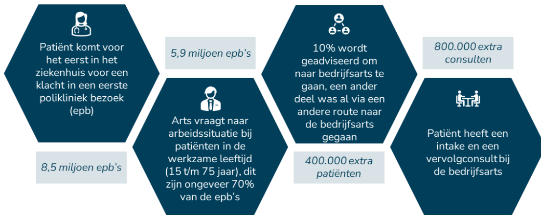
Figuur 4. Belangrijkste stappen in de patiëntreis en schatting van het aantal patiënten in Nederland.

tijdsinzet €240 miljoen per jaar (bijlage 4 voor meer details over de exacte berekening), wat neerkomt op €40 per patiënt.