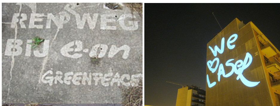
Reverse graffiti - Projection graffiti in Barcelona door Graffiti Research Lab