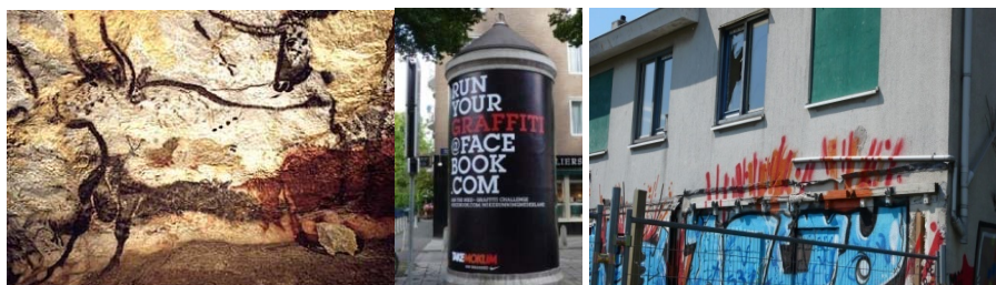
Grot-tekening in Frankrijk - Graffitireclame in Nederland – broken window in Nederland

Sinds de mens jaagt heeft hij een onstuitbare drift om te laten zien dat hij bestaat. Of het nou gaat om het markeren van zijn jachtgebied of om te tonen hoe trots hij is twee buffels te hebben gedood, de jagende mens heeft altijd een boodschap achter willen laten. Tegenwoordig kopen wij ons vlees bij slager of supermarkt, maar die drang om te laten zien waar we wonen of waar we voor staan is gebleven. Dat oerinstinct, graffiti, heeft vele kwaliteiten. Een creatieve, dynamische, soms radicaliserende. En vaak, maar zeker niet altijd, ook een ontsierende kwaliteit.