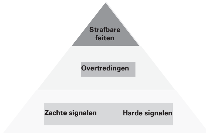
Figuur 2: Indeling naar signalen, overtredingen en strafbare feiten

Deze drie vormen staan met elkaar in verband: signalen kunnen duiden op overtredingen en die kunnen een indicatie zijn van strafbare feiten.